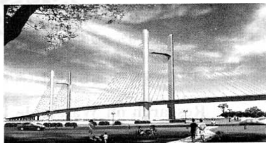
图3 在广场1位置仰望四方台大桥模拟效果

由于环形的看台,可以收到良好的视听效果。广场在视点场中呼应桥塔外挑平台的设置,当游人站在平台,俯视大地时,可以清楚得到哈尔滨天鹅城的概念。在冰城畅想广场仰望桥塔,突显桥塔的高挺、上拔,桥跨轻盈简洁,跨越感强。自冰城畅想广场仰望四方台大桥效果,如图3所示。