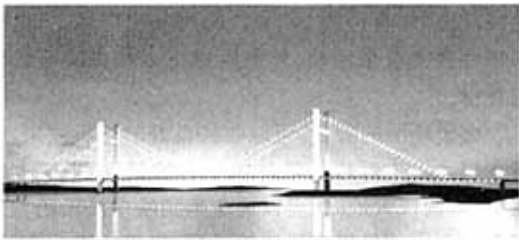
图 5 观景台 1 远眺四方台大桥夜景模拟效果

观景台 1: 设于主航道北岸图 1 中 f 区域处的江心岛上。利用江心岛广阔的视野,远眺江南岸。可以让人感受到哈尔滨市这个现代化城市的大气派,为哈尔滨市改革开放以来的所取得的伟大成就所震撼。此处可以较全面地欣赏到大桥全貌,可以很好地将桥梁的全体呈现给游人。游人也能获得对四方台大桥的全面的感受,大桥与水面的倒影相映成辉。同时,此处是观看四方台大桥的最佳位置。此处观看四方台大桥夜景的模拟效果如图 5 所示。